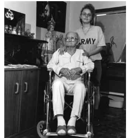
Lower West Side