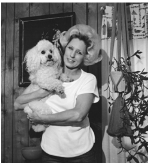
Family of Miners

Muestre dos fotografías de la misma persona, pero en contextos distintos, como en la escuela y el trabajo. Esta actividad anima a los estudiantes a imaginar la complejidad de la vida de una persona. Este ejercicio puede servir como actividad correspondiente para aprender sobre caracteres de literatura o culturas distintas y estereotipos. Estudiantes pueden imaginar fotos sobre miembros de su familia y vecindario.