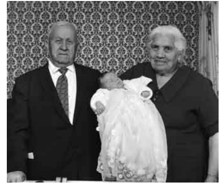
Lower West Side

En esta fotografía de un minero alemán en la sala de vestuario, objetos incluyen los cierres y cadenas de las canastas, su cigarro y el polvo de carbón sobre su cara y pecho. Pida a los estudiantes que usen lenguaje vívido. “Soy el polvo de carbón sobre la cara del minero. Estaba en esa pared escarpada más temprano hoy, pero ahora estoy hundiendo en su piel con cada toque de su mano. Entro sus pulmones y ahogará células...”