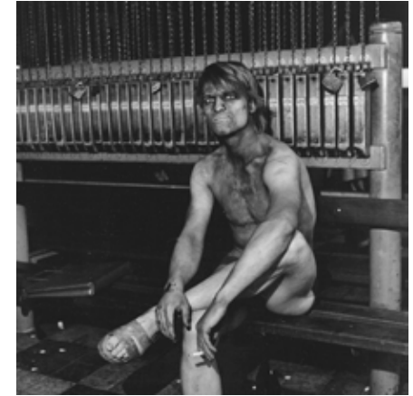
Family of Miners